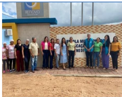
ESCOLA DE ENS. FUND. MARIA DAS DORES DE CARVALHO LIMA