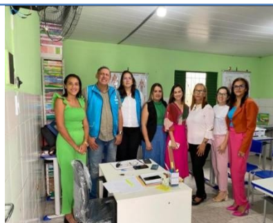
ESCOLA MUNIC. DE ED. BASICA MARIA JULIA FERREIRA DE ALBUQUERQUE