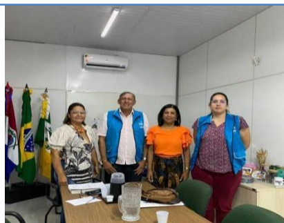
ESCOLA DE ENSINO FUNDAMENTAL MARIA DAS DORES CARVALHO LIMA