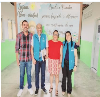
ESCOLA MUNICIPAL DE ENS. FUND. NOSSA SENHORA DA SAUDE