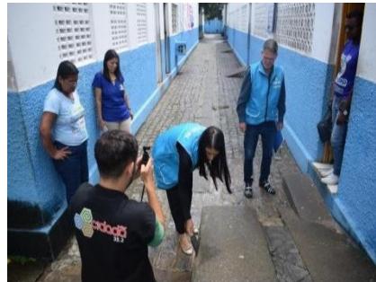
ESCOLA MUNIC. DE ENSINO FUND. JUVENAL LOPES FERREIRA DE OMENA

Imagens das pesquisas aplicadas às Escolas, em campo, no período de 24 a 26 de abril de 2023.