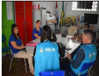
ESCOLA MUNIC. DE ED. BASICA NOSSA SENHORA DO LIVRAMENTO