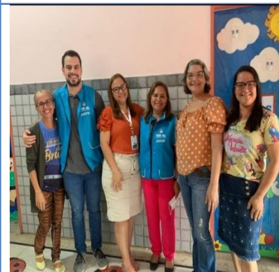
GRUPO ESCOLAR PE ALIPIO