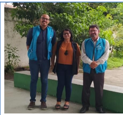
GRUPO ESCOLAR MUNICIPAL MESSIAS CALUMBY