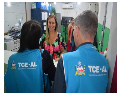
ESCOLA MUNICIPAL PROFESSORA MARILUCIA MACEDO DOS SANTOS