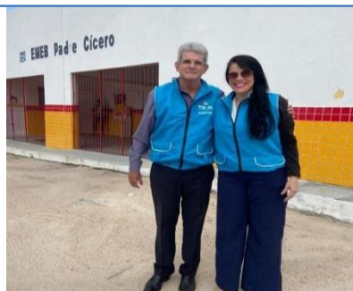
ESCOLA MUNICIPAL DE EDUC. BASICA MARIA AUGUSTA S. MELO