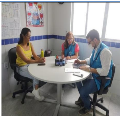
ESCOLA MUNICIPAL DE ENSINO FUND. MANOEL FERREIRA DE BARROS