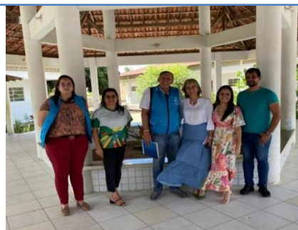
ESCOLA MUNICIPAL DE EDUCACAO BASICA DOM HELDER CAMARA