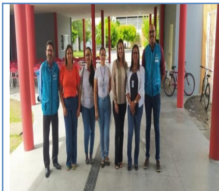
ESCOLA MUNICIPAL DE ENSINO FUNDAMENTAL DIVINA LUZ