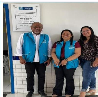
ESCOLA MUNICIPAL DE ED. BÁSICA PROFESSORA MARIA DA SILVA BRANDAO