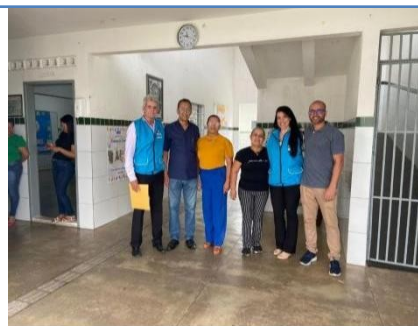
ESCOLA MUNICIPAL DE EDUC. BASICA PADRE CICERO