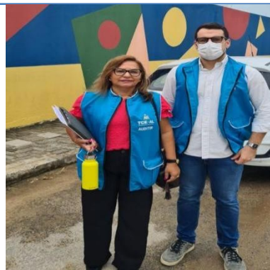
ESCOLA MUNICIPAL DE ENSINO FUND. MARIA DAS GRACAS OLIVEIRA