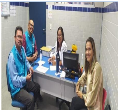
ESCOLA MUNICIPAL DE EDUCACAO BASICA SANTA LUZIA