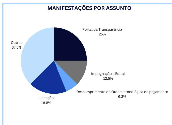
TABELA 5 – QUANTO A IDENTIFICAÇÃO DAS DEMANDAS DE OUVIDORIA