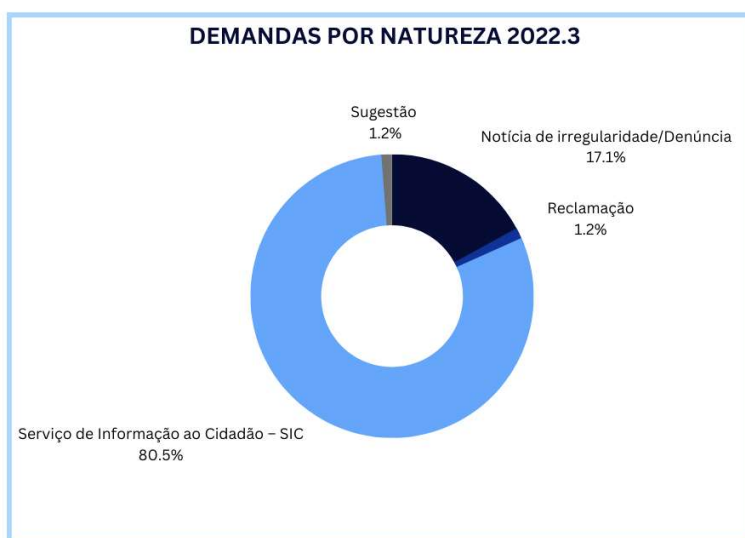
GRÁFICO 2 – Demandas recebidas por natureza 3º trimestre 2022

O quantitativo de contatos por meios dos canais de atendimento compreendem o total de 234 comunicações, conforme se apresenta na tabela abaixo: